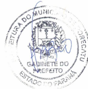
Fábio Luiz Andrade Prefeito

GABINETE DO PREFEITO DO MUNICÍPIO DE PORECATU, Estado do Paraná, aos dois dias do mês de dezembro do ano de dois mil e vinte (02.12.2020).