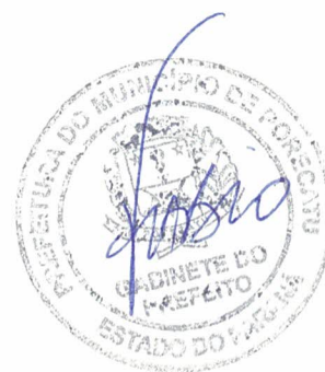
Fábio Luiz Andrade Prefeito Municipal